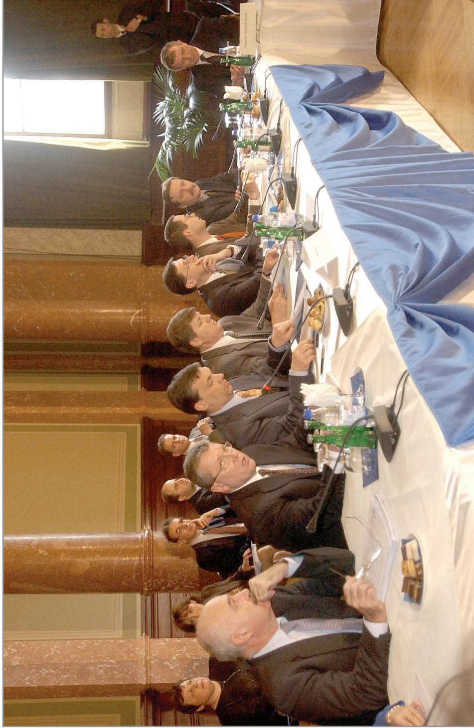
2002. január 24. A Gazdasági Tanács ülése az MTA dísztermében.

A képen balról jobbra: Martonyi János külügyminiszter, Matolcsy György gazdasági miniszter, Orbán Viktor miniszterelnök, Stumpf István kancellária miniszter, Varga Mihály pénzügyminiszter, Glatfelder Béla, a Gazdasági Minisztérium politikai államtitkára, Öry Csaba, a Miniszterelnöki Hivatal államtitkára és Járai Zsigmond, a Magyar Nemzeti Bank elnöke