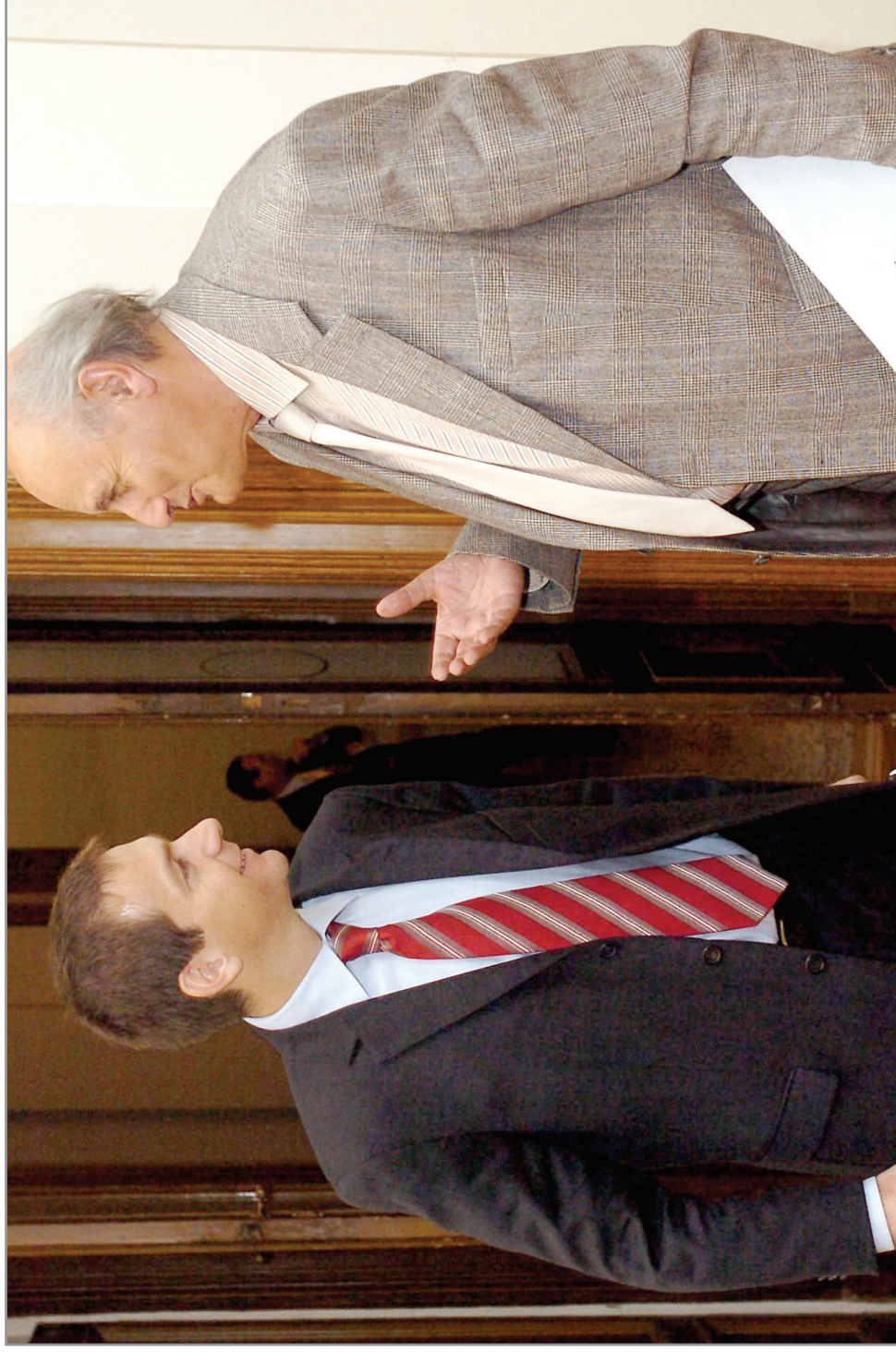
2006. november 8. Tájékoztató a GSZT plenáris ülésén az Új Magyarország Fejlesztési Tervről. Bajnai Gordon fejlesztéspolitikai kormánybiztos és Szabó Endre, a GSZT soros elnöke az ülés után beszélget