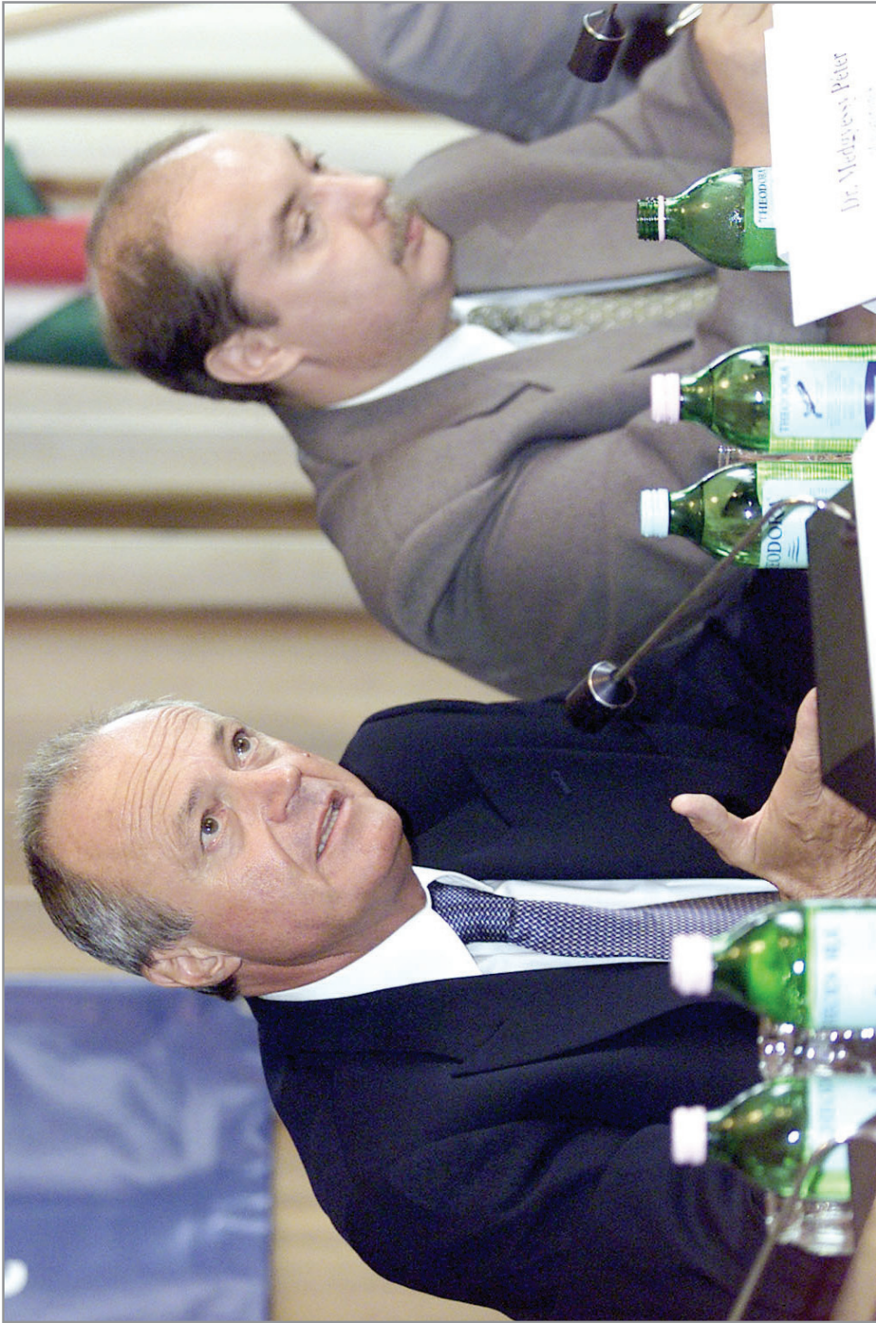
2002. szeptember 9. Medgyessy Péter miniszterelnök a Nemzeti Fejlesztési Terv megvalósításáról beszélt az OÉT ülésén (mellette Kiss Péter foglalkoztatási és munkügyi miniszter)