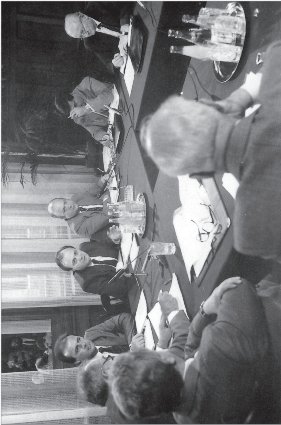
Az Országos Érdekegyeztető Tanács alakuló ülése 1988. október 14-én.